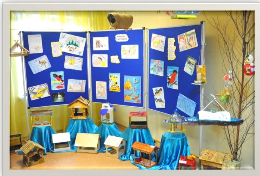
Фото 1,2. Выставка листочков, рисунков и кормушек