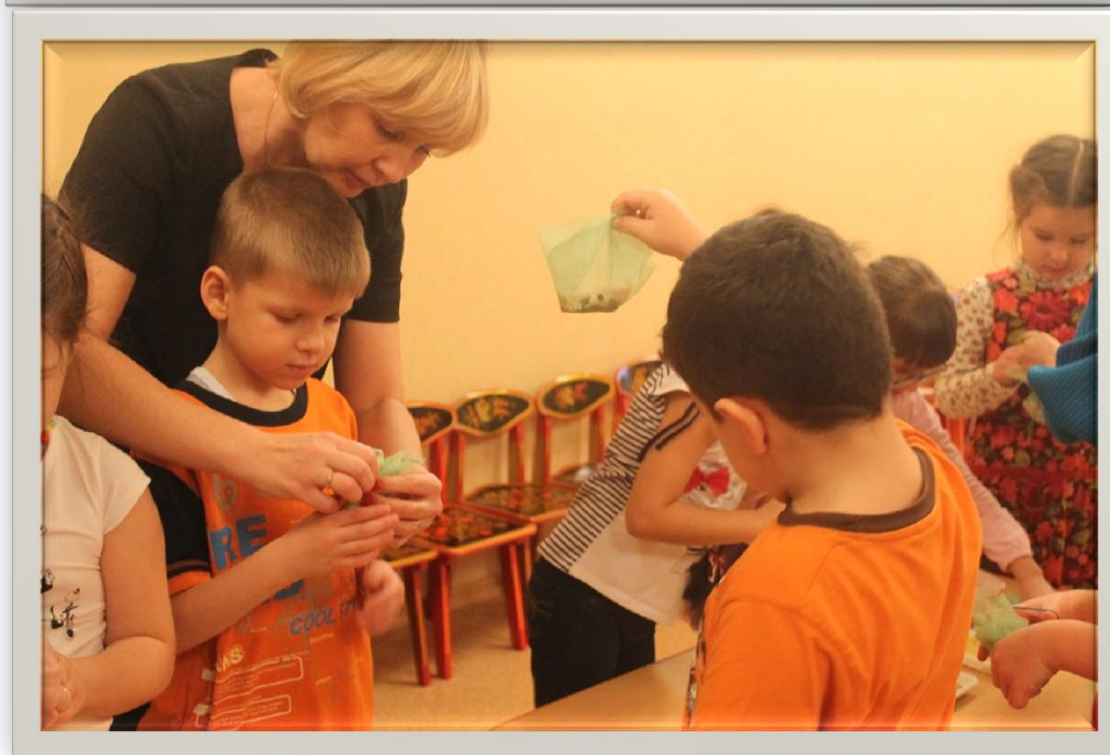
Фото 3,4. Мастер-класс по изготовлению кормушек.