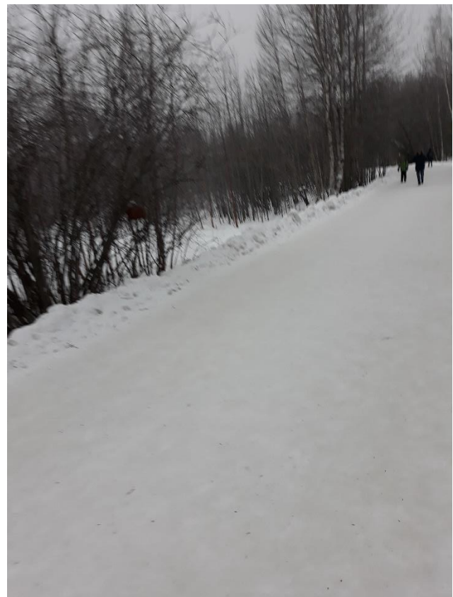
Фото 5,6 Кормушки на Комсомольском озере